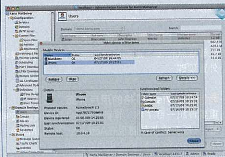
Kerio MailServer可以跟iPhone與BlackBerry等同步，確保通訊內容持續更新。

現在，10位用戶版本的Kerio MailServer一年訂購費為港幣3,892元，包括一年免費保養，即使不續保仍能使用，但不會再有技術支援及更新。